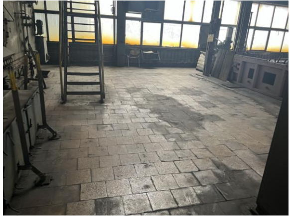
Rysunek nr 4 - Widok stropu nawęglania od spodu (po lewej) oraz widok posadzki poziomu obsługi kotłów (po prawej)