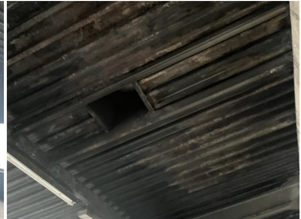
Rysunek nr 6 - Wnętrze galerii nawęglania (po lewej) dach nad galerią (po prawej)