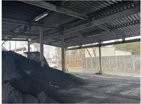
Rysunek nr 10 - Widok wiaty nad bunkrem szczelinowym węgla