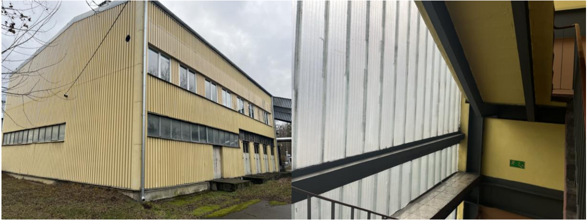
Rysunek nr 1 - Widok budynku Ciepłowni Centralnej z zewnątrz (po lewej) oraz wnętrze klatki schodowej (po prawej)