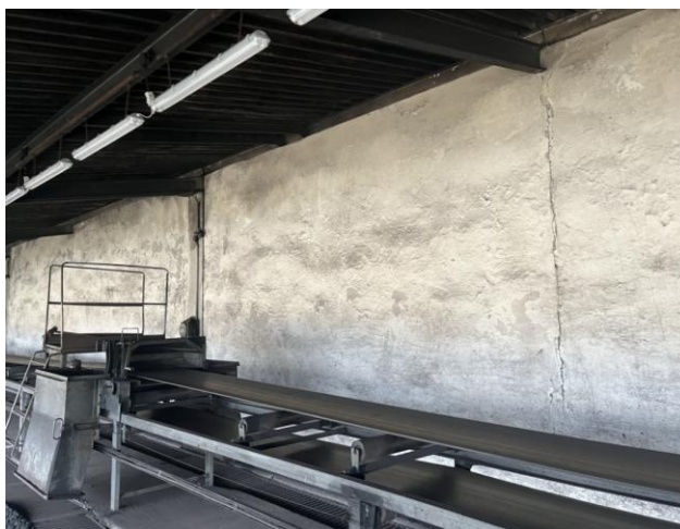
Rysunek nr 7 - Wnętrze galerii nawęglania