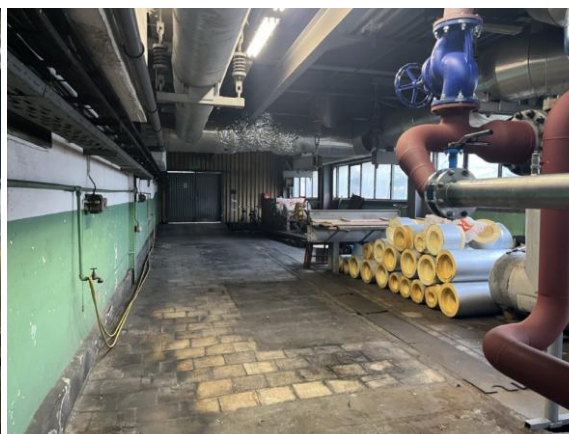
Rysunek nr 9 - Widok przyziemia kotłowni w rejonie pomp