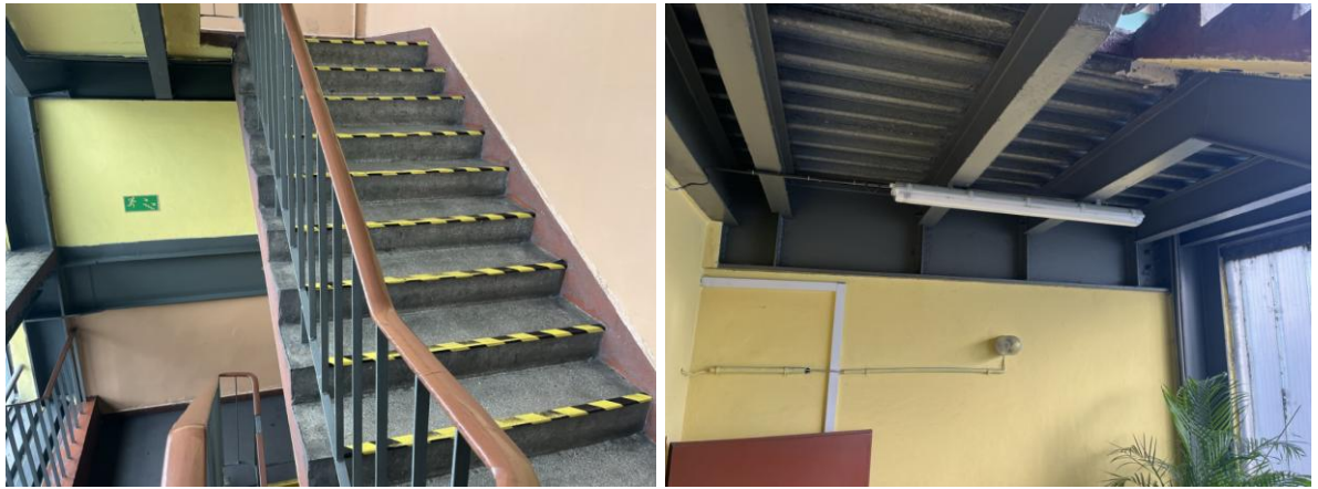
Rysunek nr 2 - Klatka schodowa