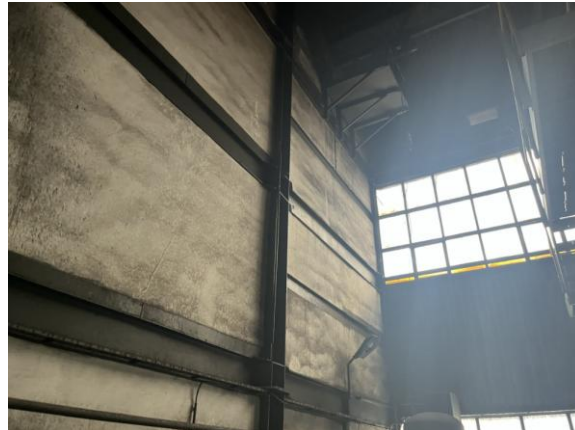
Rysunek nr 3 - Widok wnętrza hali produkcyjnej (ściana oddzielająca od klatki schodowej)