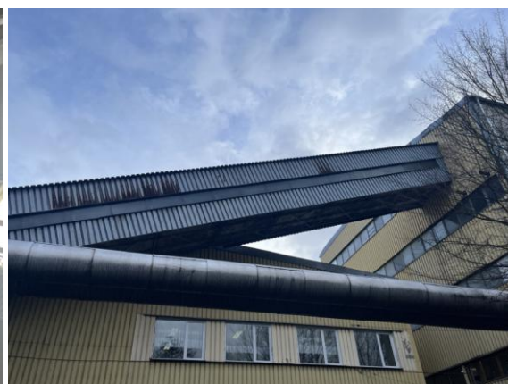
Rysunek nr 8 - Widok estakady nawęglania z wewnątrz (po lewej) i zewnątrz (po prawej)